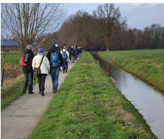
Een midwinterse wandelgroep op het Schoolpad