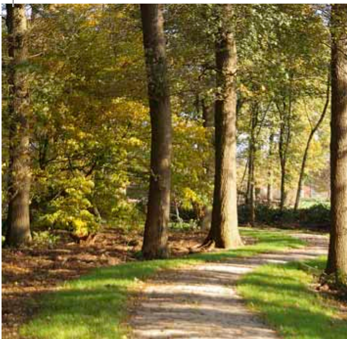
Begin Ziegenbeekpad aan de boskant