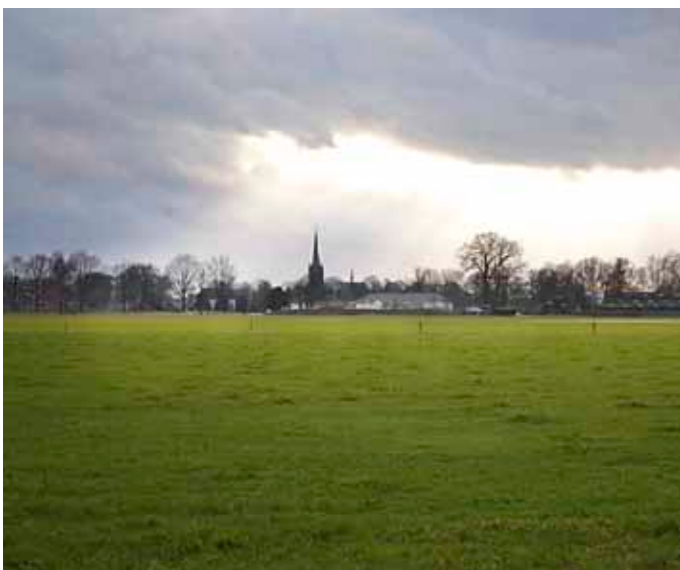
De Zieuwentse kerk vanaf het kerkepad